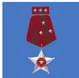
Huân chương chiến công hạng nhất các năm 1979, 1988, 1995, 2000 First class feat of arms medal in 1979, 1988, 1995, 2000

Passing of build up and grow up, the company generations always devote to make the tradition “Solidarity, collaboration, activeness, creativeness, difficult overcome, to excellently finish the commission”. Therefore, we were rewarded by The communist Party and the Government.