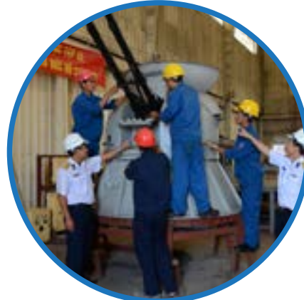
Sửa chữa khí tài Weapon repair