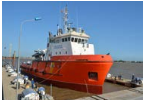
Sửa chữa các tàu Cảnh sát biển Việt Nam / Viet Nam Coast Guard Vessel