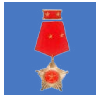
Huân chương Quân công hạng Nhì năm 2015 Second-class war Medal in 2015.