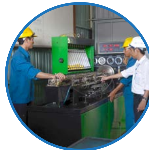
Dàn thử bơm cao áp High Pressure Pump Test Device