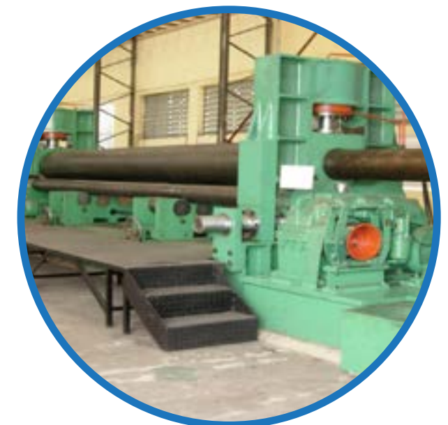
Máy lóc 3 trụ 3-Roller bending Machine