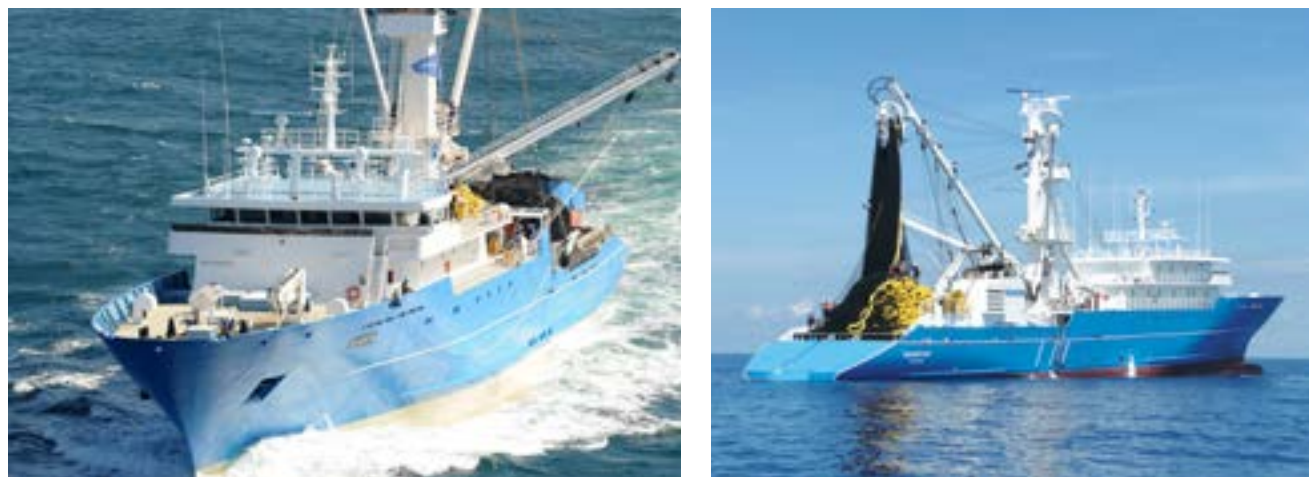
Tàu đánh bắt cá ngừ đại dương 90m / Ocean Tuna Vessel 90m