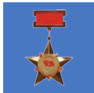
Anh hùng Lực lượng Vũ trang Nhân dân năm 2013 Awarded the title “Hero Unit People’s Armed Forces” in 2013