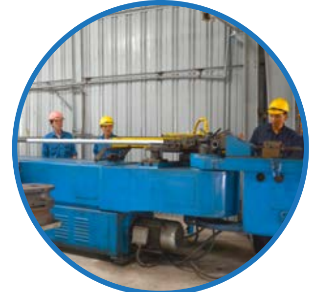
Máy uốn ống Pipe bending Machine