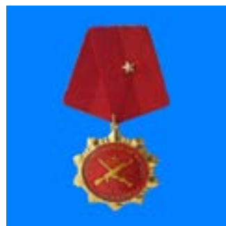
Huân chương bảo vệ tổ quốc hạng ba năm 2010 Medal of third- class Defense of the Fatherland in 2010;