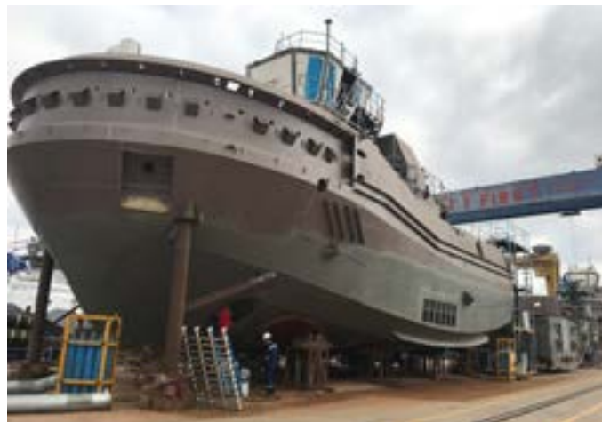
Tàu kéo 30m / TUG Boat 30m