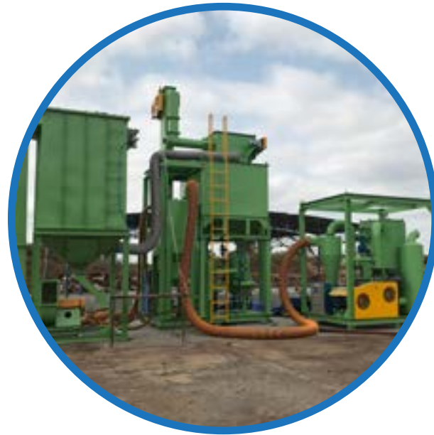
Dây truyền phun bi di động Mobile Blasting Equipment