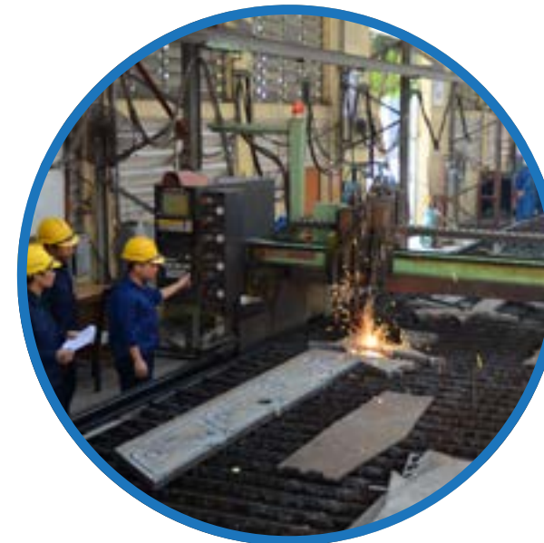
Máy cắt CNC CNC Cutting Machine Gas & Plasma

Hai Minh Shipyard has invested in modern equipment and advanced technology to ensure the best for quality, increase productivity.