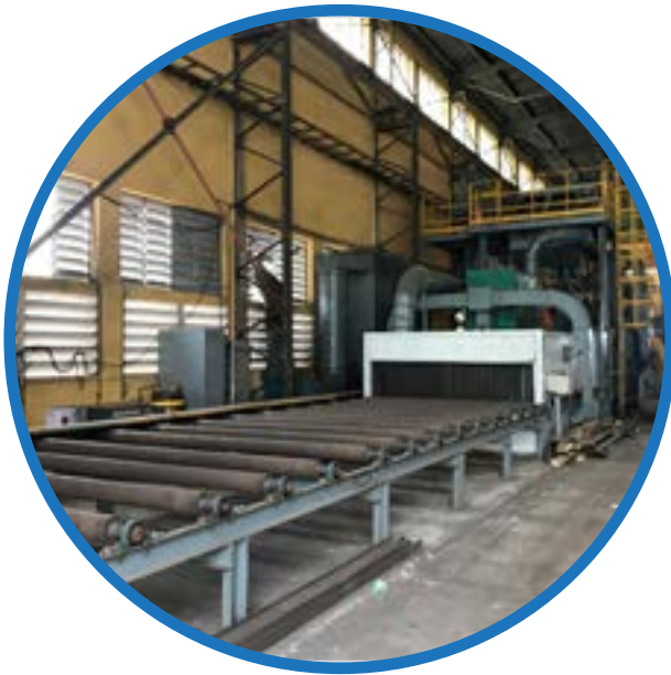
Dây chuyền phun bi & sơn Blasting and Painting Equipment