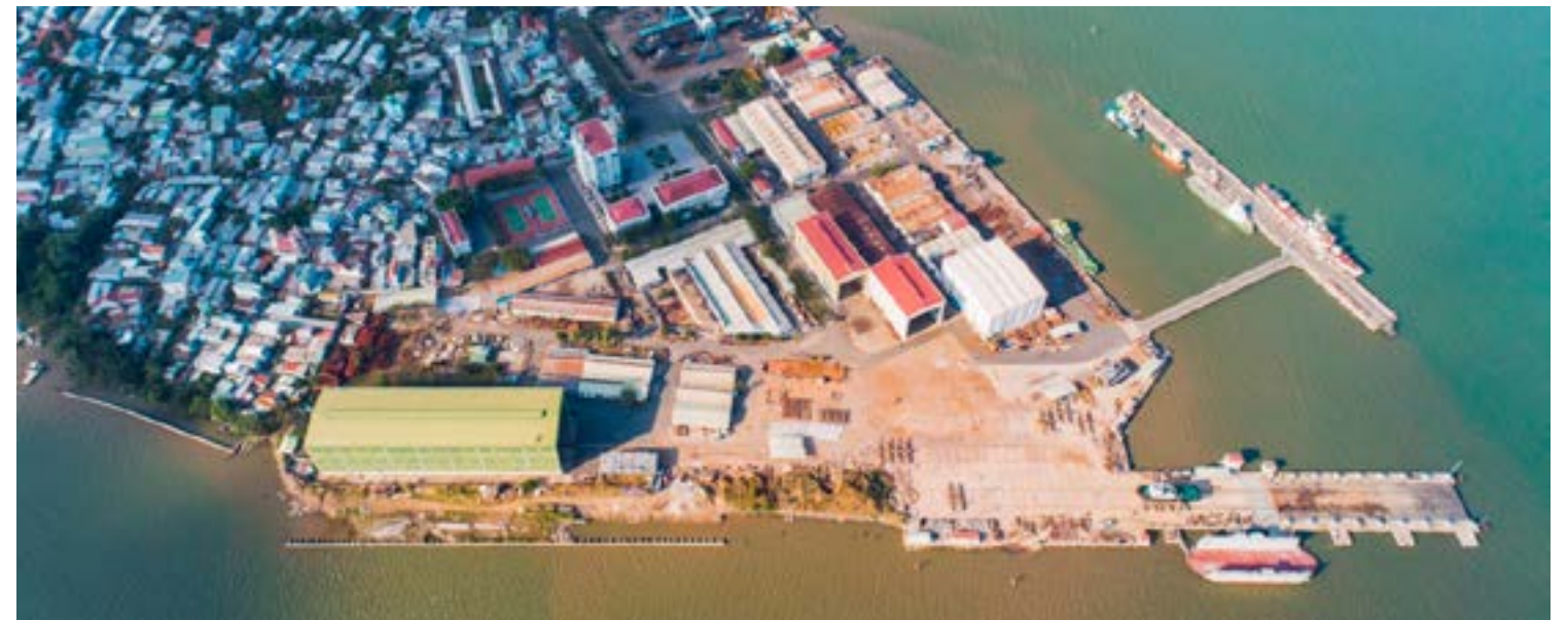
Mặt bằng tổng thể Công ty Hải Minh / Layout of Hai Minh Shipyard

Hai Minh Shipyard owns a strong source of infrastructure with total area for use near 16 hectares, office area 7.370 m 2 , workshops 10.600 m 2 , Open spaces 28.000 m 2 , Storages and Ware houses 2.630 m 2 , Quay 1000T with 294m long, Hydraulic lifting platform 2.270T, floating dock 1000T, jetty 10,000 DWT, dry dock 5.000DWT.