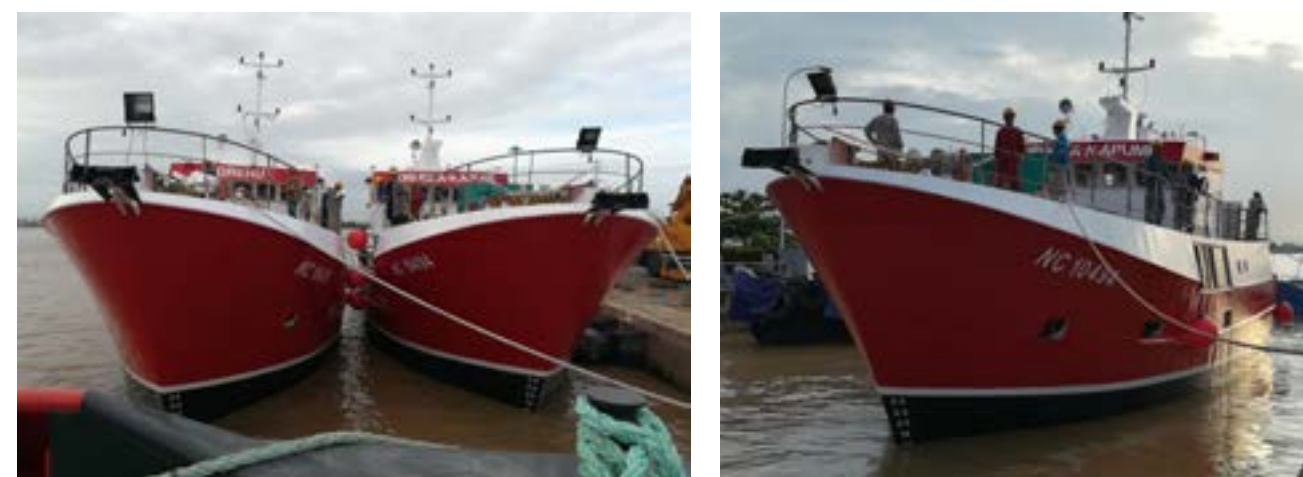
Tàu câu LongLiner 21m