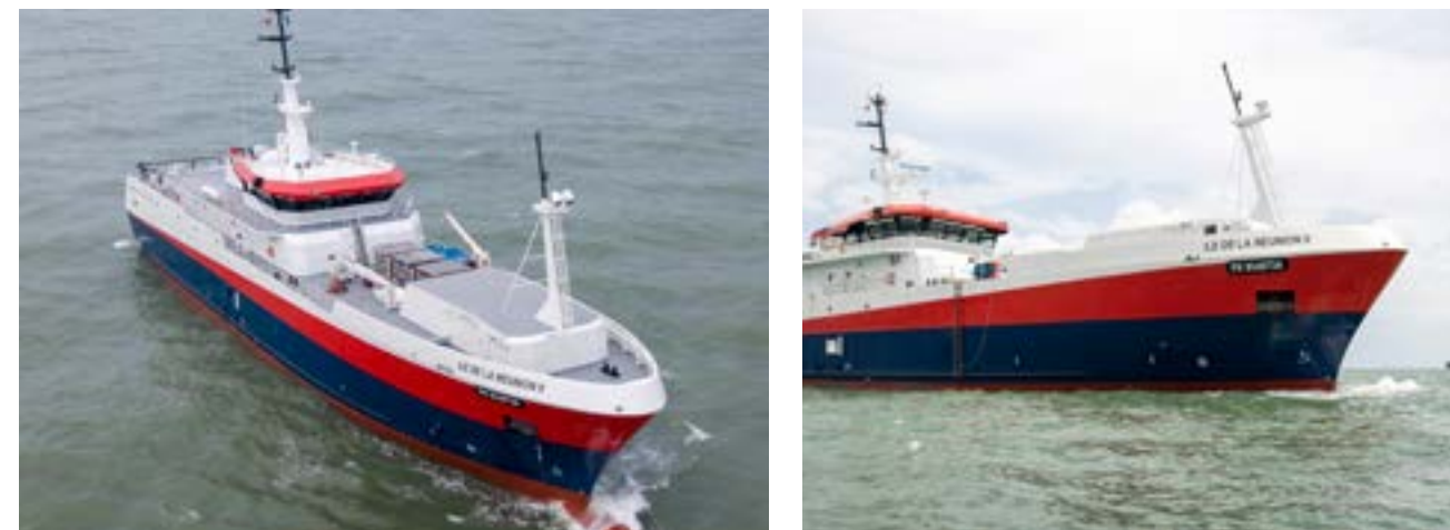
Tàu câu LongLiner 63m