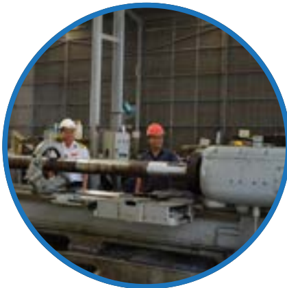
Máy tiện trục Lathe Machine