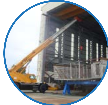
Xe cẩu 70 tấn Mobile Crane 70T