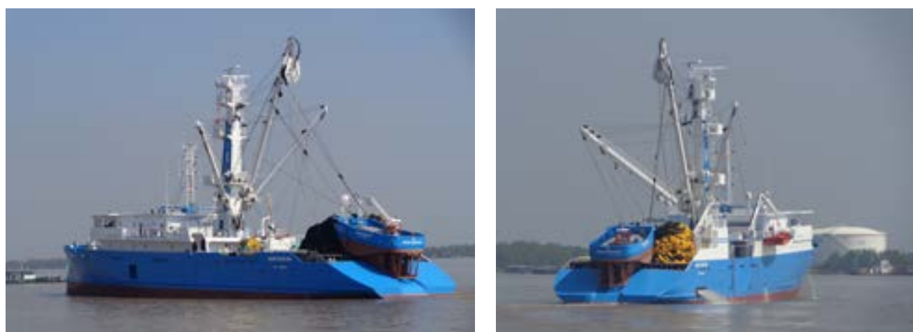
Tàu cá 80 m / TUNA Vessels 80m