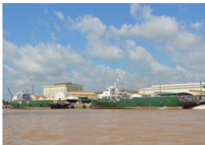
Tàu dịch vụ dàn khoan FPSV w53 / Aluminium Service Vessels FPSV w53

Đăng kiểm /Registry: BV France Đóng mới / Year built : 2014 and before Số lượng đóng/Number built: 07 Vessels Đóng mới / Year built : 2018-2020 Số lượng đóng/Number built: 08 Vessels